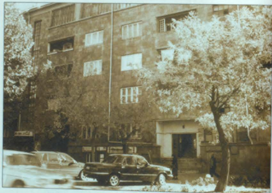
Բարեգործականի Տուն, Երևան