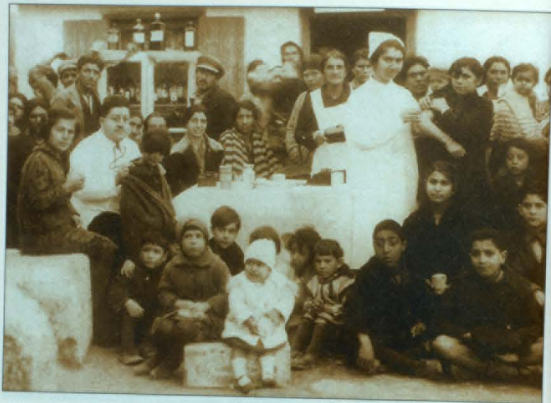
Դարձանատուն, Լիպազմա, 1920-ական թթ.