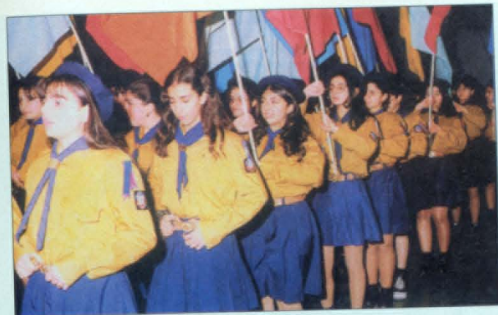
ՀԻԸՄ - ՀԵԸ սկաուտները, Գալեպ