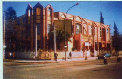
ՀԲԸՄ Կեդրոն, Կորդովա