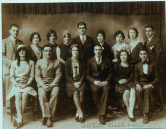
Երիտասարդաց լիգա, Ֆրեզնո, 1929թ