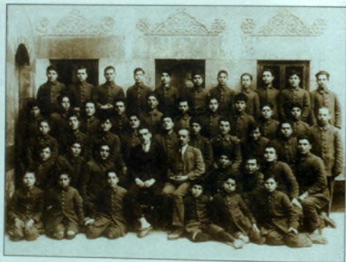
Ազատագրված որբերը Հալեպի Աշխատավոր սաների կայանում, 1920-ական թթ.