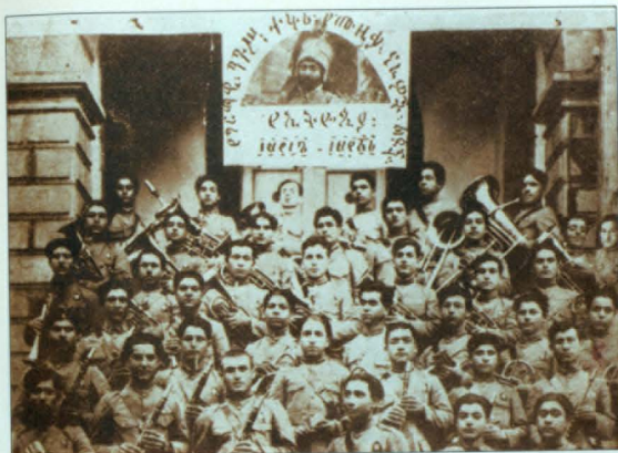
Երվակայի կայսրի հայկական նվազախուժը (Արարատյան որբանոցի նախկին ֆանֆարի խումբը)