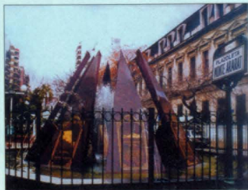
Արարատ արուակը եւ 1915թ. ցեղասպանութեան զոհերի հուշարձանը, Բուենոս Այրես