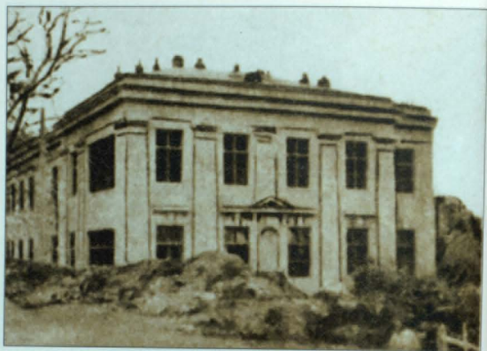
Դարուկի Յակոբեան ծննդատուն, Երևան