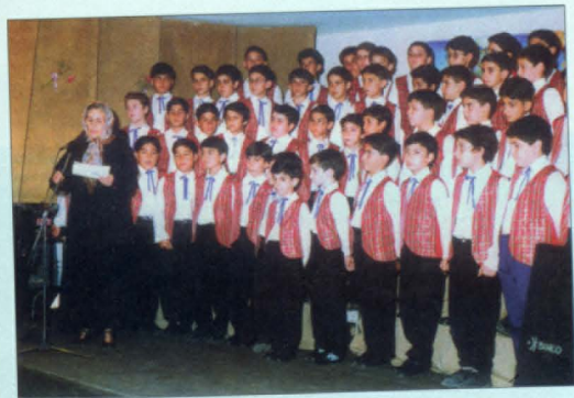
Մ.Սանուկեան Վարժարան, Թեհրան