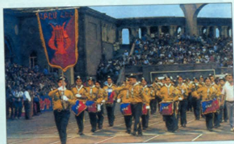
Համահայկական 2-րդ Մարզական խաղեր, 2001թ., Երևան