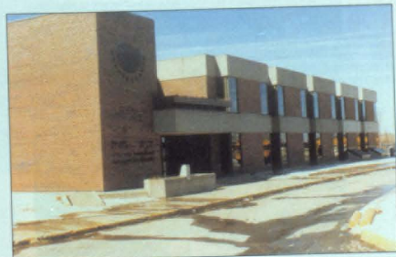
Արմեն Քելպեր - Ալ. Մանուկյան վարժարան, Սունրեալ