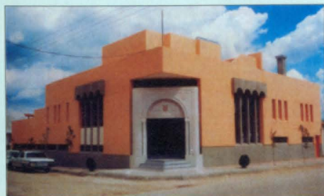
Գ.Յազուպեան Կեդրոն, Գամիշլի