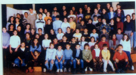
Ալ Մանուկյան շարքարյա դպրոց, Փարիզ