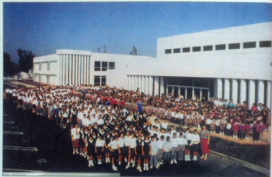
Ա.Սանուկյան - Ս.Տեմիրճեան վարժարան, Կանդաղ Պարկ