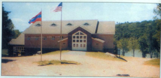
Նուպար ամառային ճամբար, Նյու Յորքի նահանգ