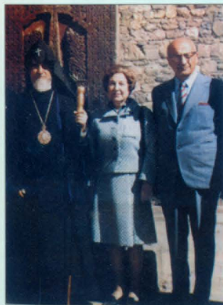
Ամենայն Հայոց Կաթողիկոս Վազգեն Ա., Մարի և Ալեք Մանուկյանները