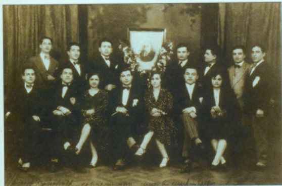
Կրթարշակատուներ, Բուենոս Այրես