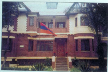
ՀՀ Դեսպանատունը, Կահիրե