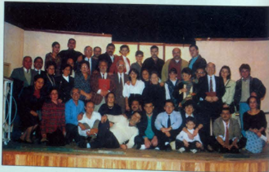
Միամեան բաժնետիրախումբ, Հալեպ