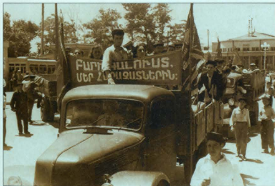
Ներգաղթողների դիմապարտեր, Երևան, 1946թ.