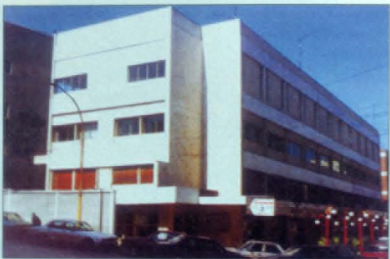
Դարուիի-Յովակիմեան վարժարան, Բեյրութ