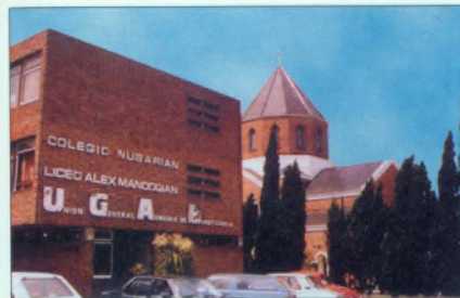
Նուպարեան-Մանուկեան վարժարան, Սոնտեվիդո