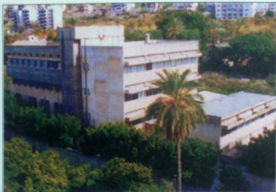
Պողոս Գ Կարմիրեան վարժարան, Բեյրութ