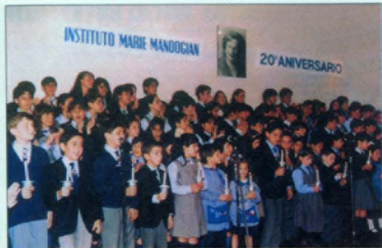
Մ.Սանուկեան վարժարան, Բուենոս Այրես