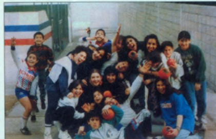
Կիրակնորյա դպրոց, Սոնտեվիդո