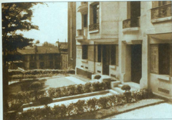
Միւլթյան կենտրոնատեղին եւ Նուպարեան Մատենադարանը, Փարիզ