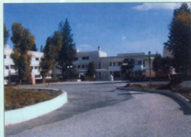
Մելգոնեան Կրթական Դասատուություն, Նիկոսիա