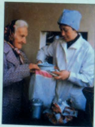
Բարեգործական ճաշարան, Երևան

Գեղարվեստի զարգացմանը նպաստող միջոցառումներից մեկը էլ հայտնվեց 1994 թվականին՝ Հայաստանի Գեղարվեստի կենտրոնի ստեղծումը։ Կենտրոնի գործունեության շնորհիվ հայաստանյայցի արվեստագետները կարողացան ավելի արագ և արդյունավետ կապեր հաստատել հայաստանյայցի արվեստագետների հետ։ Կենտրոնի գործունեության շնորհիվ հայաստանյայցի արվեստագետները կարողացան ավելի արագ և արդյունավետ կապեր հաստատել հայաստանյայցի արվեստագետների հետ։