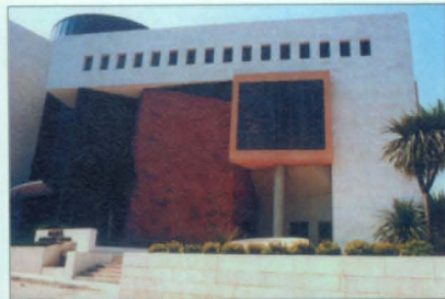
Տեմիրճեան Կեդրոն, Բեյրութ