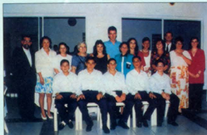
Փարեն եւ Ռեջինա Պազարեան վարժարան, Սան Պաուլո