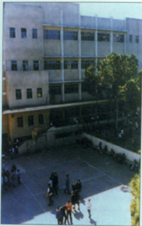
Լեւոն Կ.Նազարեան Վարժարան, Բեյրութ