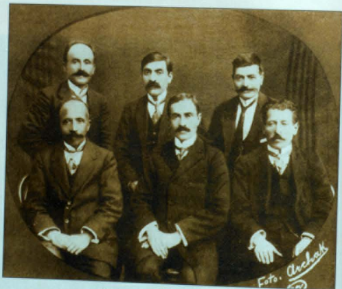
Վանքի տեղական մասնաժողով, 1913թ.