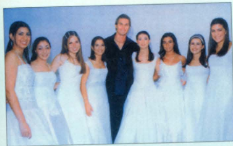
Առաջին պարահանդես, Սան Պաուլո