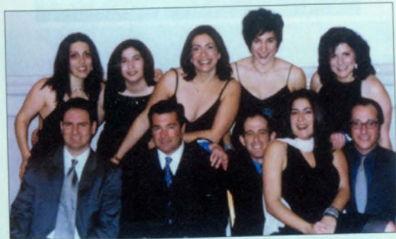
Երիտասարդ պրոֆեսիոնալների 2002թ. հավաքը, Սան Ֆրանցիսկո