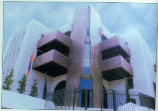
Երևանի ՆԱԲԱՐ-ի գլխավոր գրասենյակը