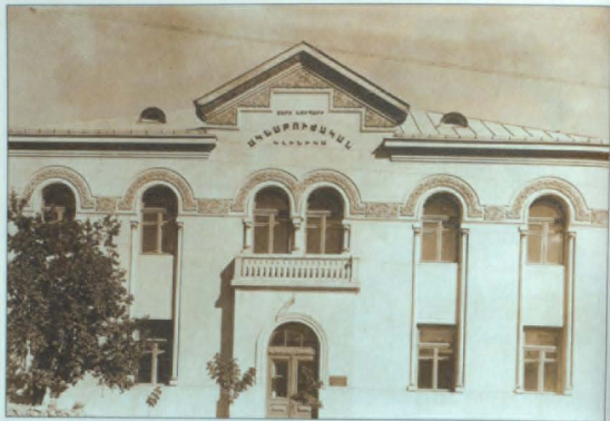
Մարի Եուպար Ալմարուժարան, Երևան